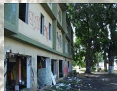
Estación Roosevelt Ave. Roosevelt