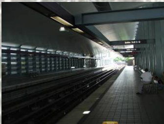
Estación Roosevelt. Domingo, 4 de noviembre, 2007

• Contemplar la posibilidad de aumentar el patrocinio del TU maximizando el espacio para mas usos alrededor de sus estaciones.